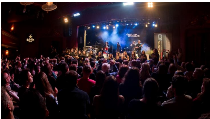
Sala Luz de Gas (Barcelona), març 2015

Des de la publicació de ' Rosalía ' (2015), han participat a festivals com el Barnasants , La Fira Mediterrània de Manresa o el Festival do Castro i han compartit escenari amb artistes com Cristina Pato , Luar na Lubre o Ses , a més de girar per Galícia en dues ocasions. La presentació d' A Xustiza pola Man va esgotar entrades a l'Auditori Barradas (L'Hospitalet), en un concert inclòs en el Festival Acròbates.