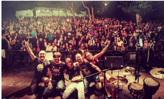
Festival do Castro (Pantón, Lugo), agost 2017